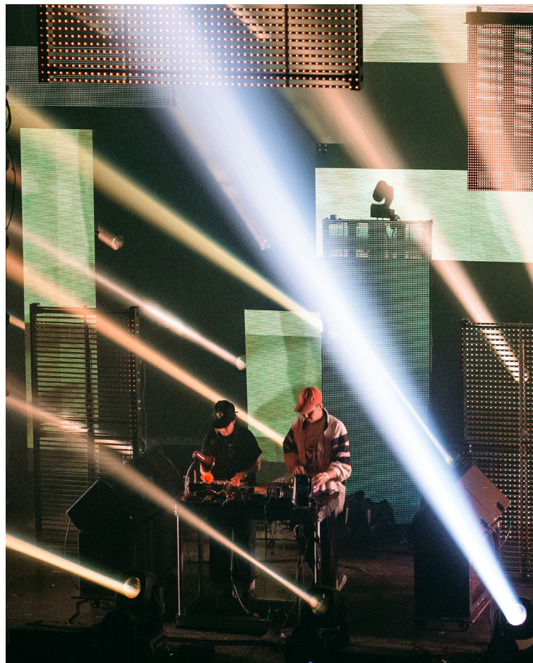
Phèdre au spectacle Nocturne du festival MUTEK

L'équipe de MUTEK a atteint la qualité de production vidéo ciblée et a pu proposer la riche expérience en ligne qu'elle espérait offrir. Elle a reformulé les spectacles Nocturne en une série de six programmes qui ont été diffusés en continu sur la plateforme virtuelle de MUTEK pendant le festival, présentant des artistes locaux talentueux aux amateurs de musique électronique du monde entier.