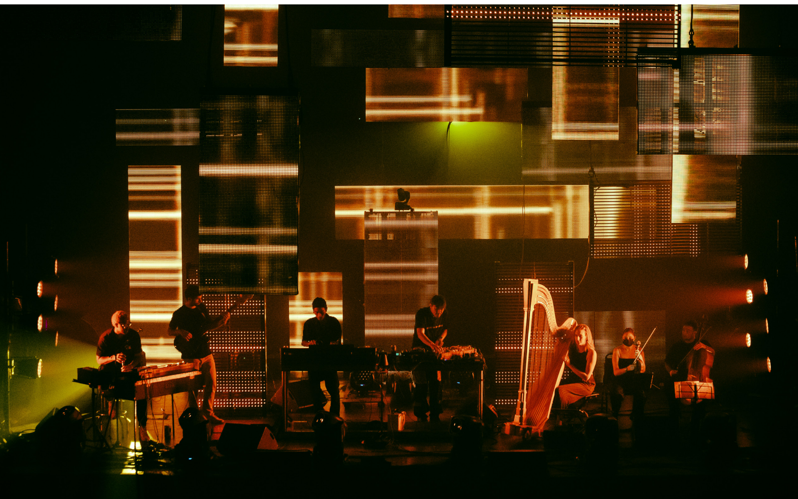
Porto Porto au spectacle Nocturne du festival MUTEK